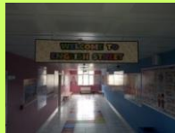
YABANCI DİL SOKAĞI