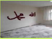
KIZ VE ERKEK MESCİDİ