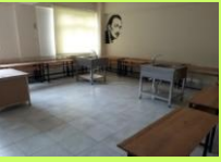
GÖRSEL SANATLAR SINIFI