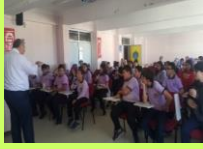
LİSE TANITIM GEZİLERİ