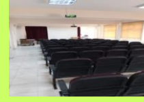
ÇOK AMAÇLI SALON