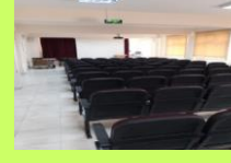
ÇOK AMAÇLI SALON