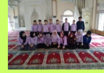
MANEVİ DEĞERLERİNE BAĞLI