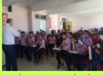
LİSE TANITIM GEZİLERİ