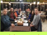
BİRLİK VE BERABERLİK