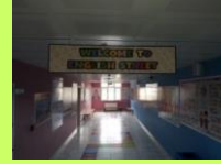
YABANCI DİL SOKAĞI