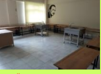
GÖRSEL SANATLAR SINIFI